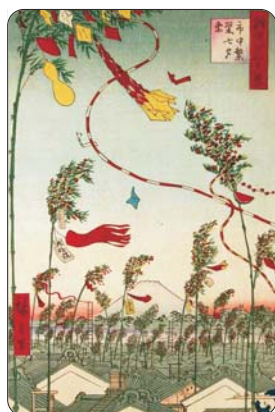
» Tanabata-Matsuri « Hiroshige Ando (1797 - 1858)

Die Sterne »Vega« und »Altair« sind die Helden dieser ursprünglich aus China stammenden Legende. Zwischen diesen beiden Sternen liegt ein »Fluß« - die Milchstraße. Vega war die Weberprinzessin, die Tochter des Himmelskaisers. Ihr Ehemann Altair war ein Hirte. Seit dem Tag ihrer Heirat hatte er vergessen sich um die Kuhherde zu kümmern. Der Himmelskaiser war sehr ärgerlich darüber und verbannte ihn auf die andere Seite der Milchstraße. Er gestattete den beiden nur ein Rendezvous im Jahr - in der Nacht des 7. Juli. Für ein Jahr erneuern sie an diesem Tag ihre Liebe. In Japan stellt man am »Tanabata-Tag« kleine, geschmückte Bambusbäume in den Garten. Man schreibt Wünsche auf Zettel und befestigt diese an den Zweigen des Bambus in der Hoffnung, dass sie sich erfüllen. Vor allem die japanische Stadt Sendai ist besonders berühmt für ihr Tanabata-Festival.