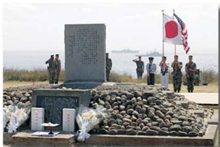
Kriegsgedenkstätte auf Iwo Jima

Kinofilme mit Japanbezug sind hierzulande eher selten. Vielleicht interessieren sich einige von Euch ebenso für diesen Film. Ich möchte Euch daher einen gemeinsamen Kinobesuch vorschlagen, sobald »Letters from Iwo Jima« auf dem Programm der Offenburger Kinos steht. Als Wochentag würde sich ein Freitag anbieten. Ein Ausklang im Bistro oder Restaurant, mit Diskussionsmöglichkeiten zum Filmgeschehen, könnte diesen Filmabend abrunden. Einen genauen Terminvorschlag schicke ich Euch noch per Rundschreibmail. Eure Rückmeldungen, Anmeldungen und sonstigen Anmerkungen sind - wie immer - jederzeit willkommen!