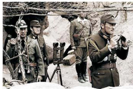
Ken Watanabe als General Tadamichi Kuribayashi

Der Deutschlandstart des Films war am 22. Februar. In den kommenden Wochen wird der Film auch in den Ortenauer Kinos anlaufen. »Letters from Iwo Jima« spielt komplett in japanischer Sprache mit deutschen Untertiteln. Der Film dauert 140 Minuten. Die Hauptrolle des Generals Tadamichi Kuribayashi spielt der aus »Last Samurai« bekannte Kensaku »Ken« Watanabe.