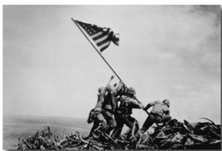
»Flag-Raising« am 23. Februar 1945

Iwo Jima liegt 1.000 km von Tokyô entfernt auf der Höhe Okinawas und wurde 1877 von Japan annektiert. Nach Ende des 2. Weltkriegs war die Insel noch bis 1968 von den Amerikanern besetzt. Heute ist sie unbewohnt. Traurige Berühmtheit erlangte das Schlachtfeld von Iwo Jima durch ein Foto des Associated-Press-Fotografen Joe Rosenthal. Rosenthal war damals als Kriegsberichterstatter in der Pazifikregion. Am 23. Februar 1945 fotografierte er fünf amerikanische Soldaten, als sie nach Einnahme des Vulkans Suribachi das Sternenbanner auf dem Gipfel hissten. Das Bild ging um die Welt und wurde zur Vorlage für das »United States Marine Corps War Memorial« in Rosslyn, Virginia, nahe Washington (D.C.). Joe Rosenthal wurde dafür mit dem Pulitzer-Preis, der berühmten amerikanischen Auszeichnung für journalistische Leistungen geehrt.