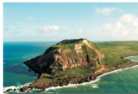
Der erloschene Vulkan »Suribachi«

In der Gegend um den erloschenen Vulkan Suribachi fanden heftige Kämpfe statt. Die Japaner nutzten ein vorhandenes und nur schwer einnehmbares Höhlensystem für ihre Verteidigung. Dennoch hatte die kaiserliche Armee in Anbetracht der amerikanischen Übermacht keine Chance. Am 26. März 1945 waren die Kämpfe auf Iwo Jima beendet. General Tadamichi Kuribayashi soll angeblich »seppuku« begangen haben. Wie er wirklich starb wurde jedoch nie bekannt.