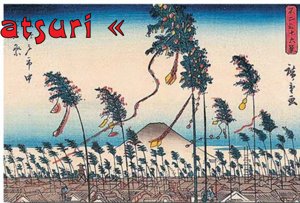
» Tanabata-Matsuri « Hiroshige Ando (1797 - 1858)

Liebe IAIDOKAI-Mitglieder, Freunde der Schwertkampfkunst,