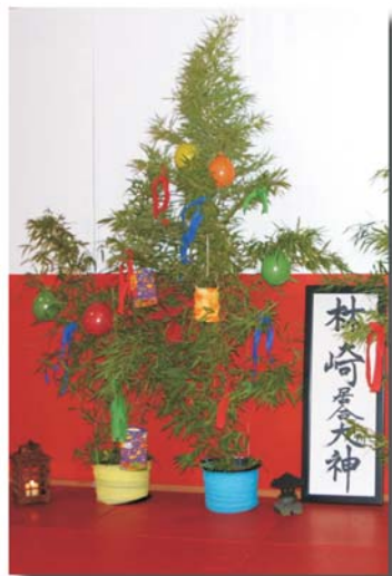
» Tanabata-Matsuri « im IAIDOKAI-Dôjô 07.07.2005

Die Sterne »Vega« und »Altair« sind die Helden dieser ursprünglich aus China stammenden Legende. Zwischen diesen beiden Sternen liegt ein »Fluß« - die Milchstraße. Vega war die Weberprinzessin, die Tochter des Himmelskaisers. Ihr Ehemann Altair war ein Hirte. Seit dem Tag ihrer Heirat hatte er vergessen sich um die Kuhherde zu kümmern. Der Himmelskaiser war sehr ärgerlich darüber und verbannte ihn auf die andere Seite der Milchstraße. Er gestattete den beiden nur ein Rendezvous im Jahr - in der Nacht des 7. Juli. Für ein Jahr erneuern sie an diesem Tag ihre Liebe. In Japan stellt man am »Tanabata-Tag« kleine, geschmückte Bambusbäume in den Garten. Man schreibt Wünsche auf Zettel und befestigt diese an den Zweigen des Bambus in der Hoffnung, dass sie sich erfüllen. Vor allem die japanische Stadt Sendai ist besonders berühmt für ihr Tanabata-Festival.