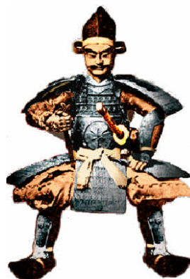
Hayashizaki Jinsuke Minamoto no Shigenobu (1546 - 1621) Begründer des Eishin-Ryū